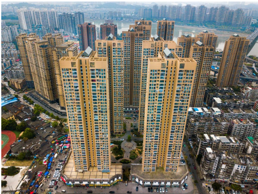
图为我司施工的福机生活第一区工程（省级文明工地、省优良工程）