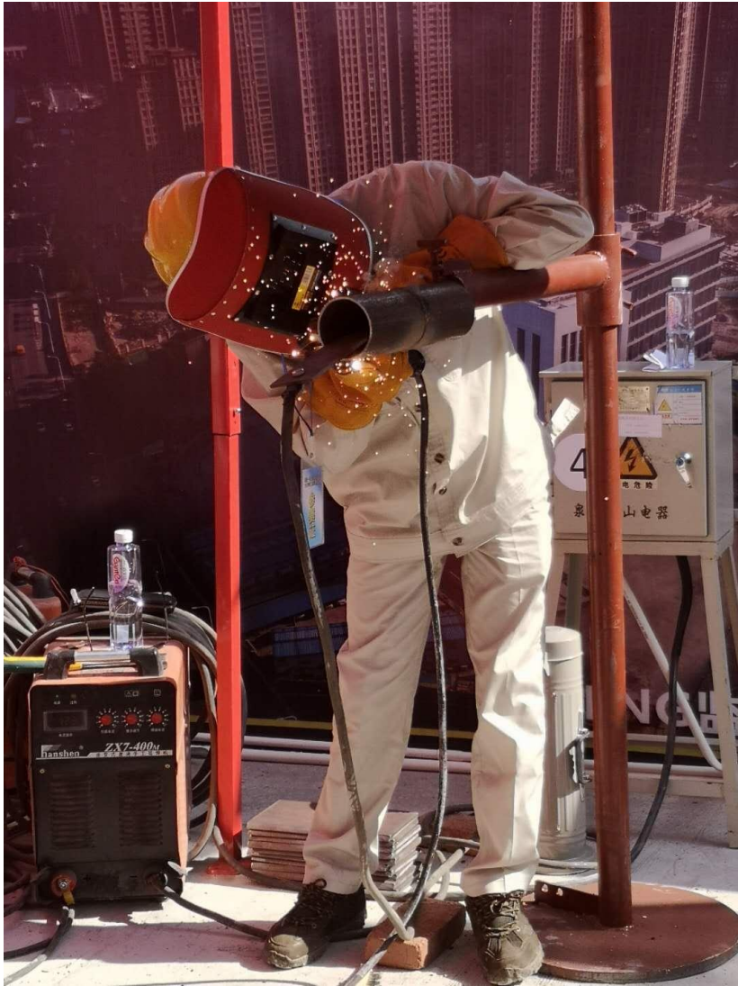
《技能竞赛》 “醉美·最忆是一建”摄影比赛获奖作品选登